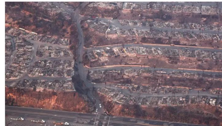
An aerial view of homes destroyed by the Palisades Fire on January 9, 2025.